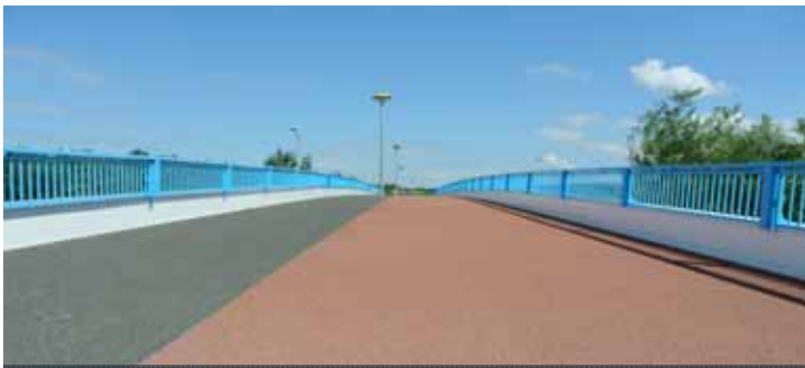
Brugdekken - Gemeente Lelystad