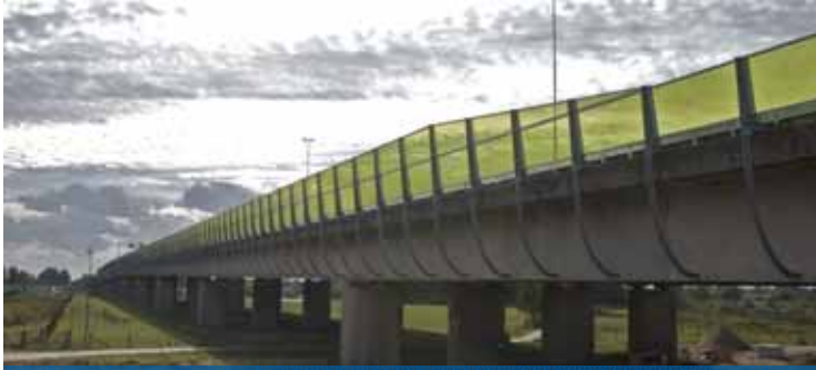
Schermen Maasbrug Zaltbommel - Redubel