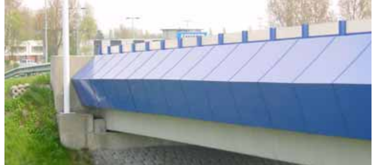
Nauerna, Zaanstad - Beplating, leuning en geluidsscherm