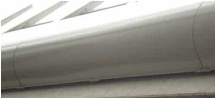
Brugbekleding Den Uylbrug Zaandam - Ballast Nedam