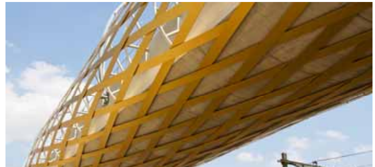
Bekleding Sporen Den Bosch, De Netkous - Sorba Projects