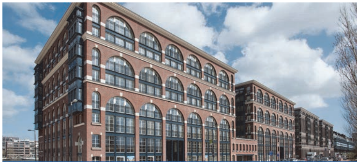
Schipper Kozijnen - Nieuw Argentinie