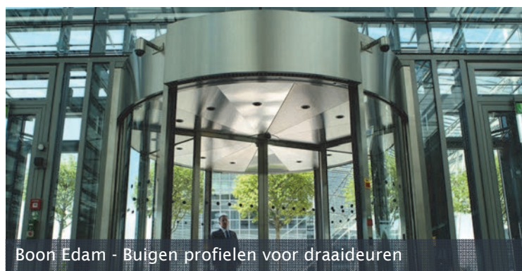
Boon Edam - Buigen profielen voor draaideuren