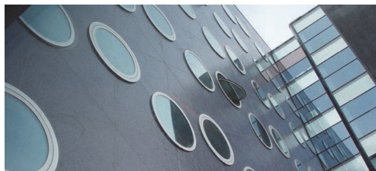
Rijkswaterstaat - Rijswijk