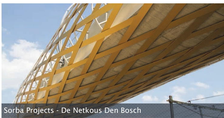
Sorba Projects - De Netkous Den Bosch